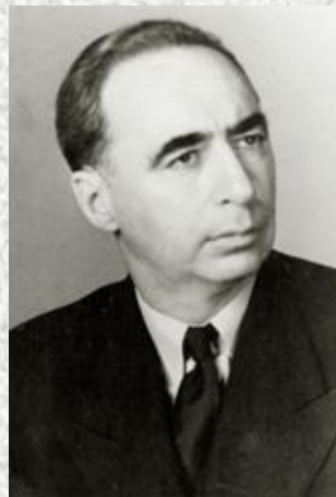
Hans J. Morgenthau Twórca realizmu klasycznego 3