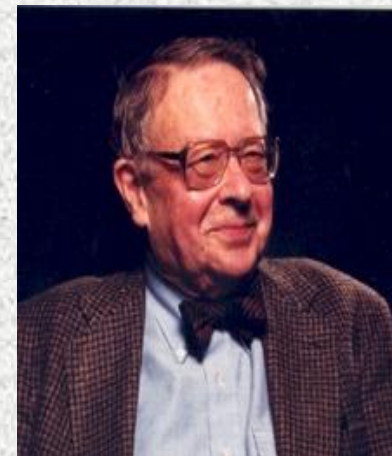
Kenneth N. Waltz Twórca realizmu defensywnego 2